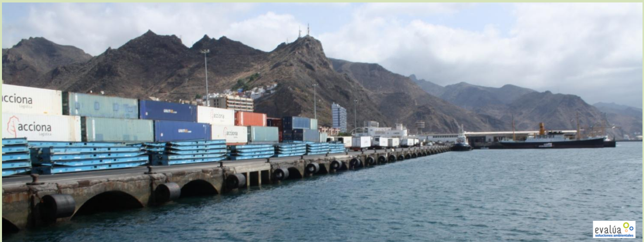
Detalle de una de las explanadas con contenedores.