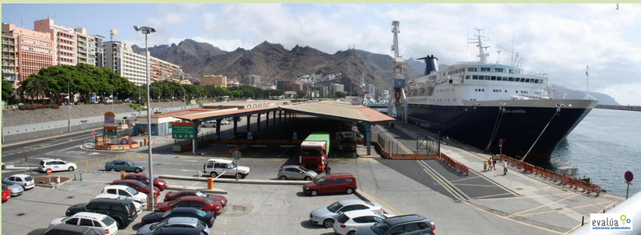
Detalle de los "tinglados" de la Dársena de Anaga.