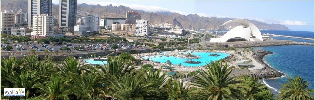
Panorámica tomada desde el "Palmetum".

Adjuntamos imágenes de distintos sectores portuarios donde se pueden apreciar los usos internos y límites: