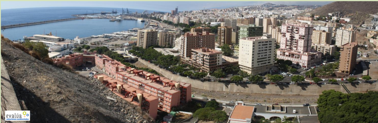
Panorámica tomada desde "El Barrio de La Alegría".