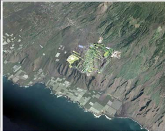
INFOGRAFÍA 1. Esta infografía pretende dar una visión inicial de como quedaría la ejecución del Proyecto de "Aridane Golf", sobre el territorio y el entorno sobre el que se pretende desarrollar.