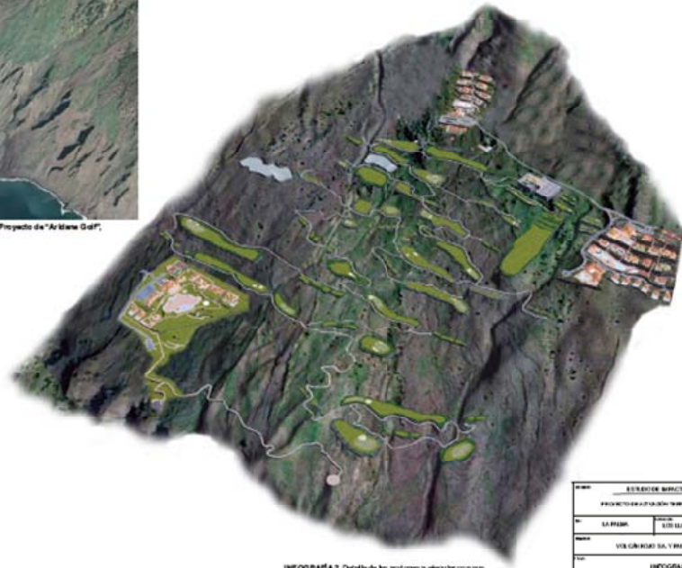
INFOGRAFÍA 2. Detalle de las acciones a ejecutar con sus efectos locales de orden y tipo de construcción.